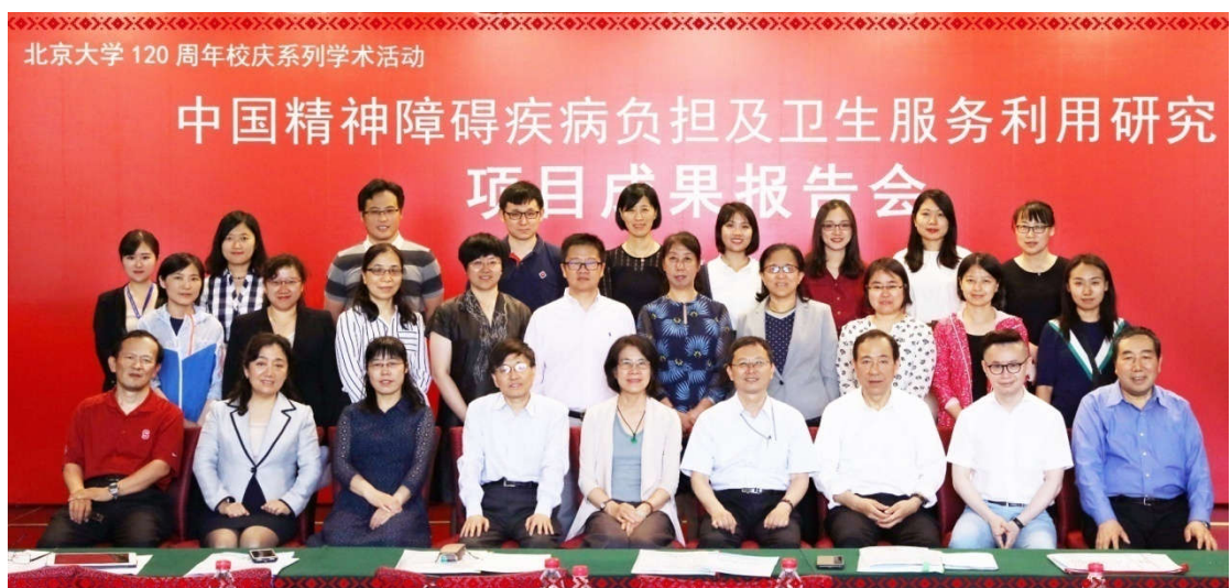
2018年5月项目成果报告会