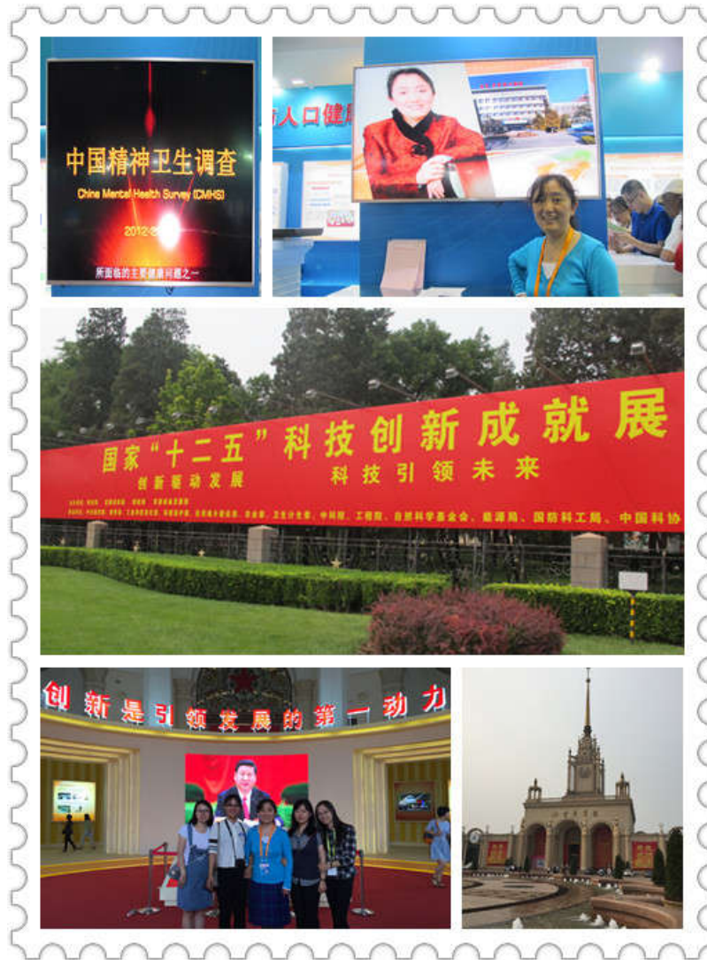
2016年6月十二五科技创新成就展