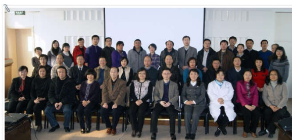
2012 年 2 月项目启动会

CMHS 的主要数据由卫生健康委疾控局于 2017 年 4 月 7 日世界卫生日公布，在国家十二五科技创新成就展上展示，还在北京大学 120 周年校庆活动中报告，后续将发表系列科研文章。这是全国精神卫生工作者取得的重大成果，更是我们六院的荣耀！ (社会室 刘肇瑞 黄悦勤)